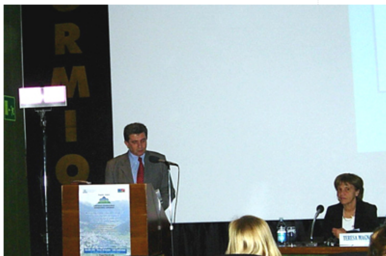
Fig. 1 - L'intervento del direttore generale dell'ARPA