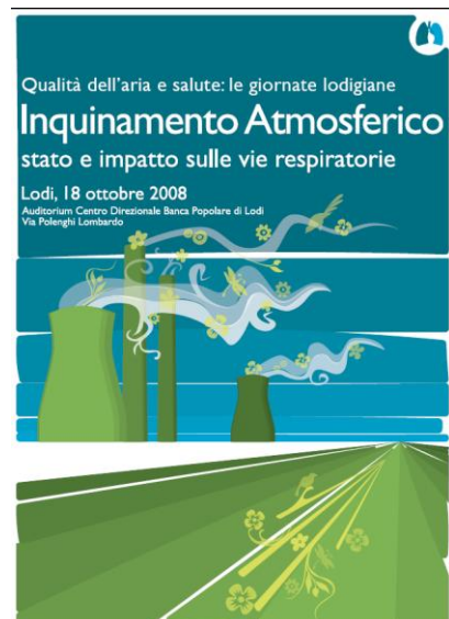
La locandina del convegno del 18 ottobre

E' possibile iscriversi al convegno e consultare il programma completo all'indirizzo internet: www.mayaidee.it