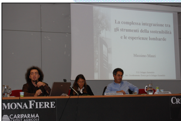
Convegno "La Produzione e il Consumo Sostenibile – Dall'Europa alle Regioni".

Il Convegno è stato un importante momento di riflessione e confronto sulla strategia di produzione e consumo sostenibile, in linea con gli assi tematici del Forum, e si è sviluppato partendo dalle recenti novità introdotte dal Piano di azione europeo sino alle esperienze maturate a livello nazionale e regionale. Un prezioso contributo al convegno è stato fornito da Herbert Aichinger della Commissione Europea – Direzione Generale Ambiente, con una relazione dal titolo "SPC - Dalla strategia al Piano d'Azione Europeo".