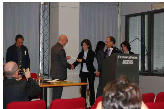
Consegna premio Compraverde-BuyGreen

Presenti anche Regione Lombardia e Arpa Lombardia con uno stand comune e con la presenza importante della Centrale Acquisti (Lombardia Informatica).