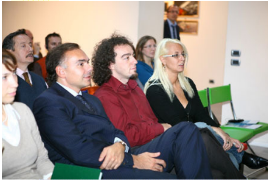
Il Fiera Forum della Registrazione Ambientale EMAS

Nella seconda giornata sono stati approfonditi i contenuti del nuovo regolamento EMAS III attraverso un workshop di quattro tappe, ciascuna delle quali ha previsto una relazione introduttiva e un momento di discussione con numerosi interventi da parte delle realtà territoriali e settoriali presenti.