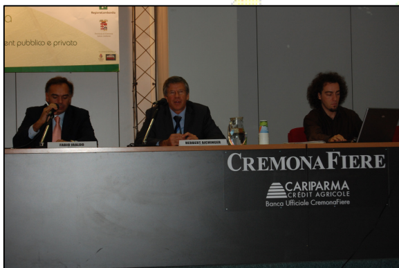
Convegno "La Produzione e il Consumo Sostenibile – Dall'Europa alle Regioni".

Il Convegno è stato un importante momento di riflessione e confronto sulla strategia di produzione e consumo sostenibile, in linea con gli assi tematici del Forum, e si è sviluppato partendo dalle recenti novità introdotte dal Piano di azione europeo sino alle esperienze maturate a livello nazionale e regionale. Un prezioso contributo al convegno è stato fornito da Herbert Aichinger della Commissione Europea – Direzione Generale Ambiente, con una relazione dal titolo "SPC - Dalla strategia al Piano d'Azione Europeo".