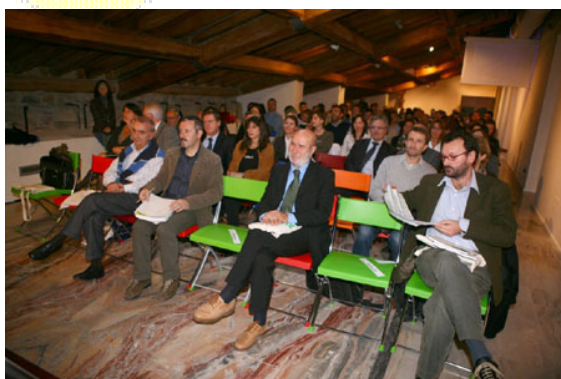
Il Fiera Forum della Registrazione Ambientale EMAS

Nei giorni 23, 24 e 25 ottobre si è svolta a Bergamo, presso la sede della Provincia, la II Fiera Forum della registrazione ambientale EMAS, iniziativa voluta dalla Provincia, con il contributo di Regione Lombardia e con il patrocinio della Commissione Europea e di Arpa Lombardia.