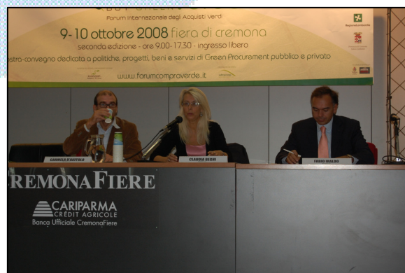
Convegno "La Produzione e il Consumo Sostenibile - Dall'Europa alle Regioni".

Venerdì 10 ottobre 2008 Arpa Lombardia con il supporto di Arpa Toscana, ha organizzato un convegno intitolato "La Produzione e il Consumo Sostenibile - Dall'Europa alle Regioni".