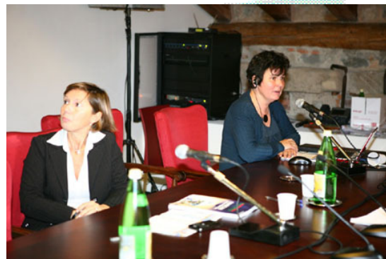
Il Fiera Forum della Registrazione Ambientale EMAS

Numerosi i partecipanti sia ai workshop di approfondimento, che ai convegni; hanno preso parte all'evento anche rappresentanti della Commissione Europea e dell'EMAS Help Desk.